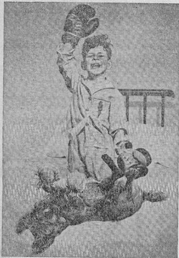
"Yo solito lo vencí porque como Pulpa Cubana".

Se complace en saludar a sus amigos y distinguidos colaboradores deseándoles muy felices pascuas y un venturoso año nuevo.